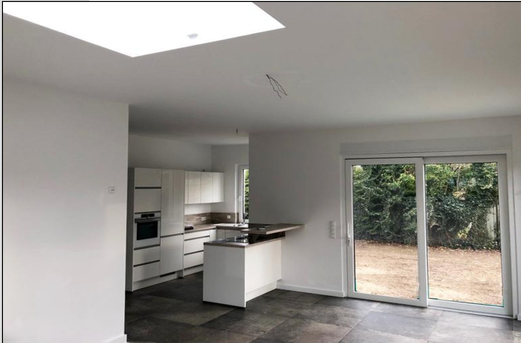
Blick in die offene Wohnküche