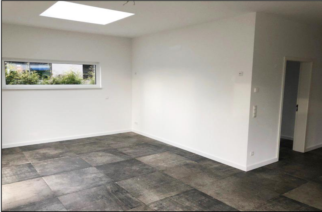
Wohn-/ Essbereich mit Oberlicht